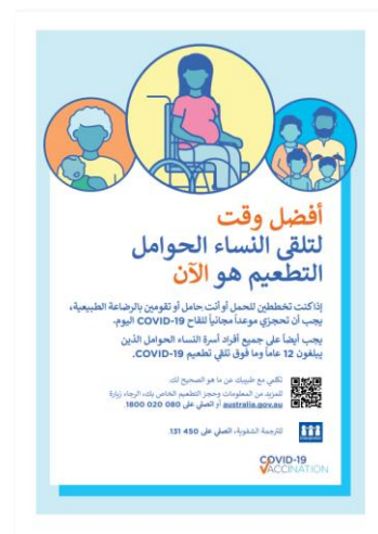
اضغط للتحميل Download this poster