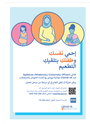
اضغط للتحميل Download this poster