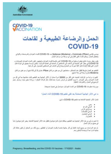
اضغط للتحميل Download this fact sheet

The best time for women who are pregnant and breastfeeding to get vaccinated is right now. Download posters and a fact sheet with important information about why women who are pregnant or breastfeeding, or are planning to get pregnant, should get the COVID-19 vaccine.