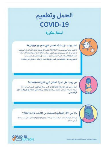
اضغط للتحميل Download this fact sheet